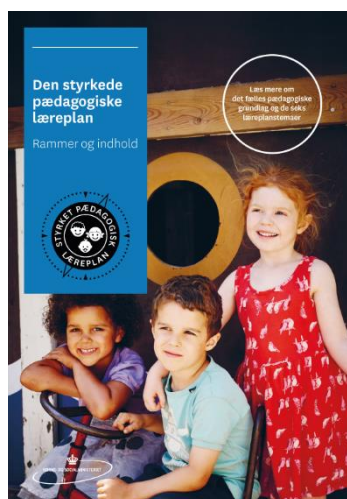
Den styrkede pædagogiske læreplan, Rammer og indhold

Inden for de krav, der følger af dagtilbudsloven, er det op til jer at beslutte, hvordan I konkret vil arbejde med den pædagogiske læreplan. Jeres læreplan skal være et dynamisk og meningsfuldt dokument, som peger fremad, og som I kan bruge aktivt i den løbende udvikling af den pædagogiske kvalitet og jeres pædagogiske praksis.